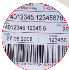
Etiquetado de pallets y de cajas