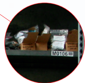
Etiquetado de lineales