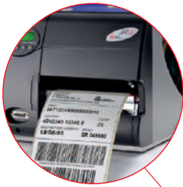
Selección de pedidos/ Aparcamiento