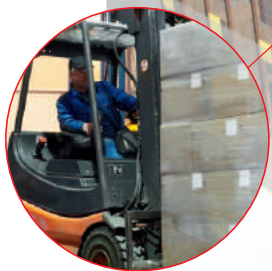
Etiquetado de seguridad