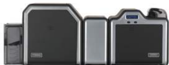
Impresora/codificadora dual con opción de laminación

El diseño modular crece junto con sus necesidades. ¿No está seguro lo que requerirán sus aplicaciones de tarjetas de identificación en el futuro? Esto no es un problema. El modelo HDP5000 se actualiza fácilmente para adaptarse a sus necesidades. Empiece por una unidad básica de una sola cara. Instale los módulos de codificación. Actualice a una impresión dual. Agregue laminación sencilla o una laminación dual simultánea para lograr lo más moderno en cuanto a seguridad y durabilidad de las tarjetas.