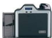
Impresora/codificadora de una sola cara

Las tarjetas de alta definición brindan la mejor calidad de imagen con la más alta funcionalidad. La película HDP se fusiona con la superficie de las tarjetas inteligentes y de proximidad, ajustándose a los relieves que se forman en las tarjetas con chip incrustado.