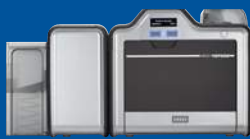
Impresora/codificadora de doble cara

HID Global introdujo la impresión de alta definición (HDP) en 1999 y hemos estado perfeccionando la tecnología desde entonces. La HDP5600 refleja nuestro compromiso a una innovación inspirada en los clientes y la evolución de nuestra familia de soluciones de Impresión de alta definición. Robustas y confiables, las impresoras/codificadoras de tarjeta HDP5600 de quinta generación de HID Global ofrecen la calidad de impresión con la que puede contar su organización y los avances tecnológicos que desea. Además, una confiabilidad de quinta generación significa mayor tranquilidad y menos tiempo muerto de impresión, y debido a que la cabeza de impresión nunca entra en contacto con las superficies de las tarjetas o desechos, nunca se daña en el proceso de impresión. De hecho, cuenta con una garantía vitalicia.