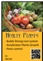
Horticultura, Plantas y Semillas