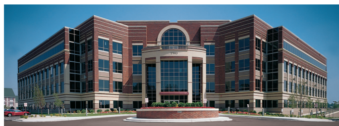
Primera Technology, Inc. USA