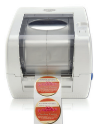
FX400e FOIL IMPRINTER

El distribuidor de etiquetas DX850e despegga individualmente etiquetas autoadhesivas del rollo. El sustituye el proceso que normalmente es manual, de tal manera que se eleva considerablemente la productividad y el nivel de automatización.