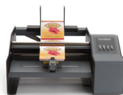
DX850e LABEL DISPENSER

La máquina de etiquetar de la serie AP facilita casi automáticamente el etiquetar de envases cilíndricos y cónicos, como por ejemplo botellas, latas, vasos o tubos.