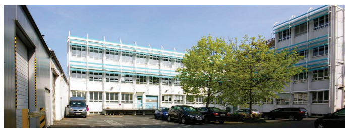
Primera Technology Europe, Alemania

Primera Technology , es líder en el desarrollo por sistemas especiales de impresoras, en su historia de muchos años como empresa produjo más de un millón de impresoras de chorro de tinta, térmica y de matriz. Es un garante con una técnica de alta calidad y con un resultado de impresión excelente por un precio imbatible!