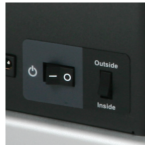
Interruptor para seleccionar la dirección de giro