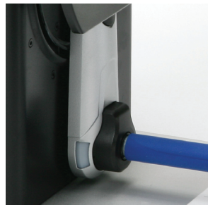
Led multicolor que indica el estado del dispositivo