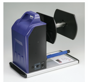
Diseño elegante y construcción robusta para una gran durabilidad